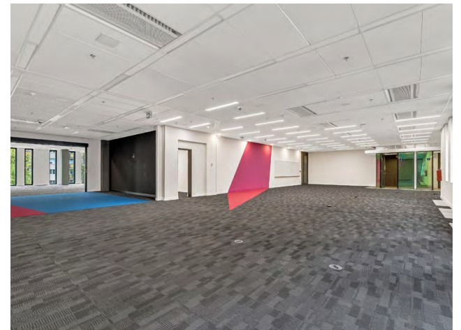
Blox 3. NP